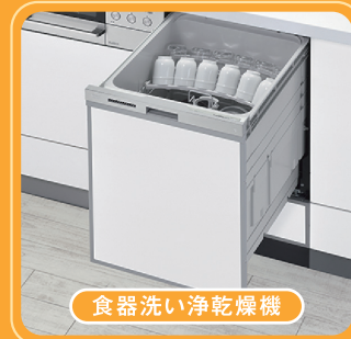
食器洗い浄乾燥機