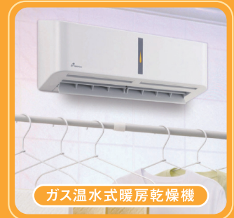
ガス温水式暖房乾燥機