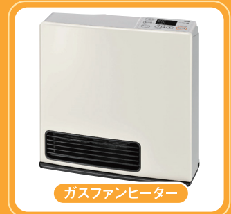
ガスファンヒーター